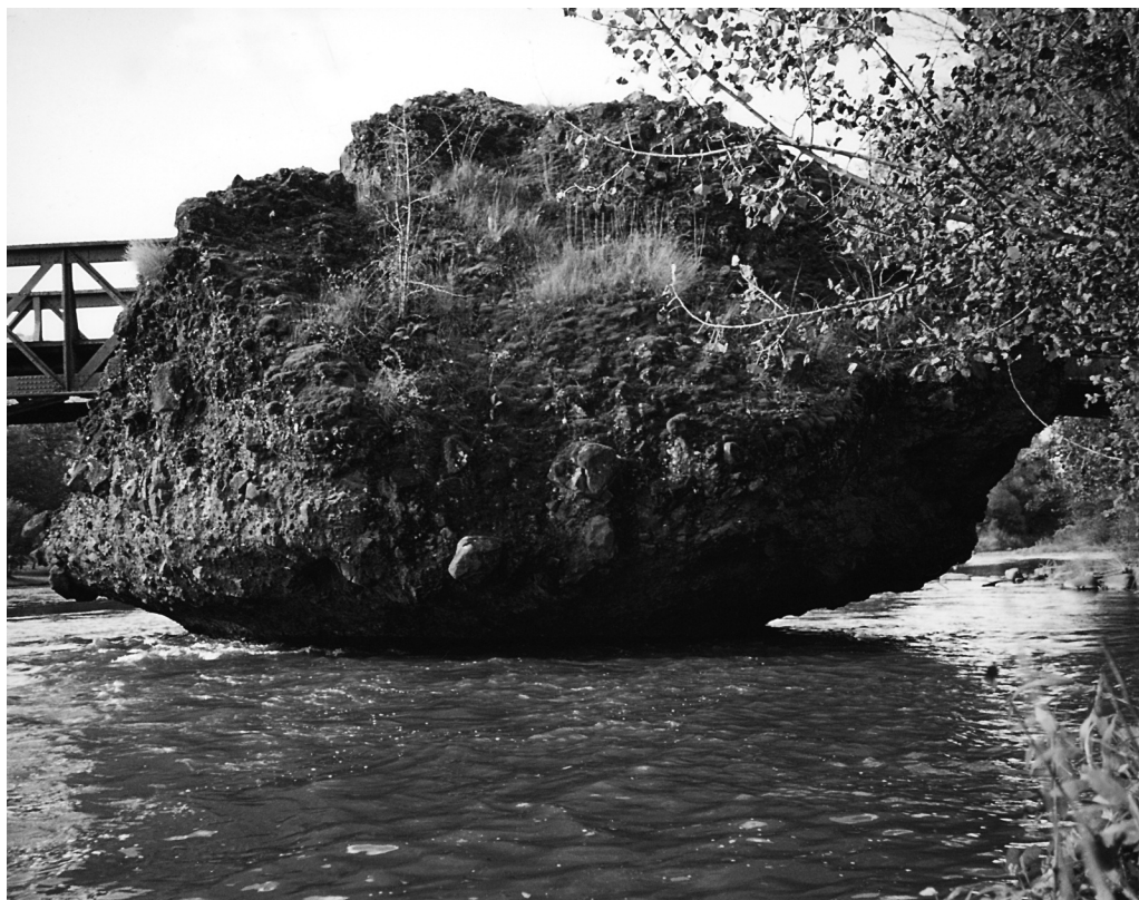
A kő marad...

„Olyanok, akik egyszerre tartoznának a felső és alsóbb osztályokba akár műveltségük, akár tehetségük vagy vagyonuk folytán, Magyarországon igen kevesen vannak. A polgárság csaknem teljes egészében hiányzik még, az érdekek közelítése ez által nagyon megnehezül. Hiányzik a középvezető. Az alsóbb néprétegek tetteje és szorgalma nem érvényesül. A műveltség és a tehetség hatalma nem tör át ezen a távolságon. Mindegyik egyedül magára van utalva. Hiányzik egymás kölcsönös támogatása.